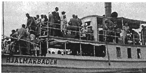
Passagerarbåten HjälmARBADEN lägger till.