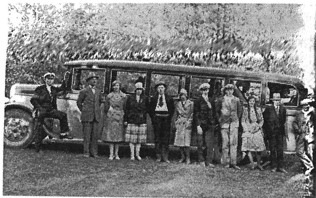
Ungdomar från Sundby och Ekeby på bussutfärd omkring 1935. Bussen hade dörrar på båda sidor mitt för varje sittplatsrad. Ägare Knut Oskar Gustavson.

Jag har ett eget minne från en sådan söndag, jag var cirka åtta – nio år och hade skadat mig i ett knä och fått lov att fara till lasarettet i Örebro och blivit sydd på knäskålen. Lasarettbesöket skedde på lördag och jag blev då skjutsad liksom sedan på söndagen till Storängsviken av en snäll granne som